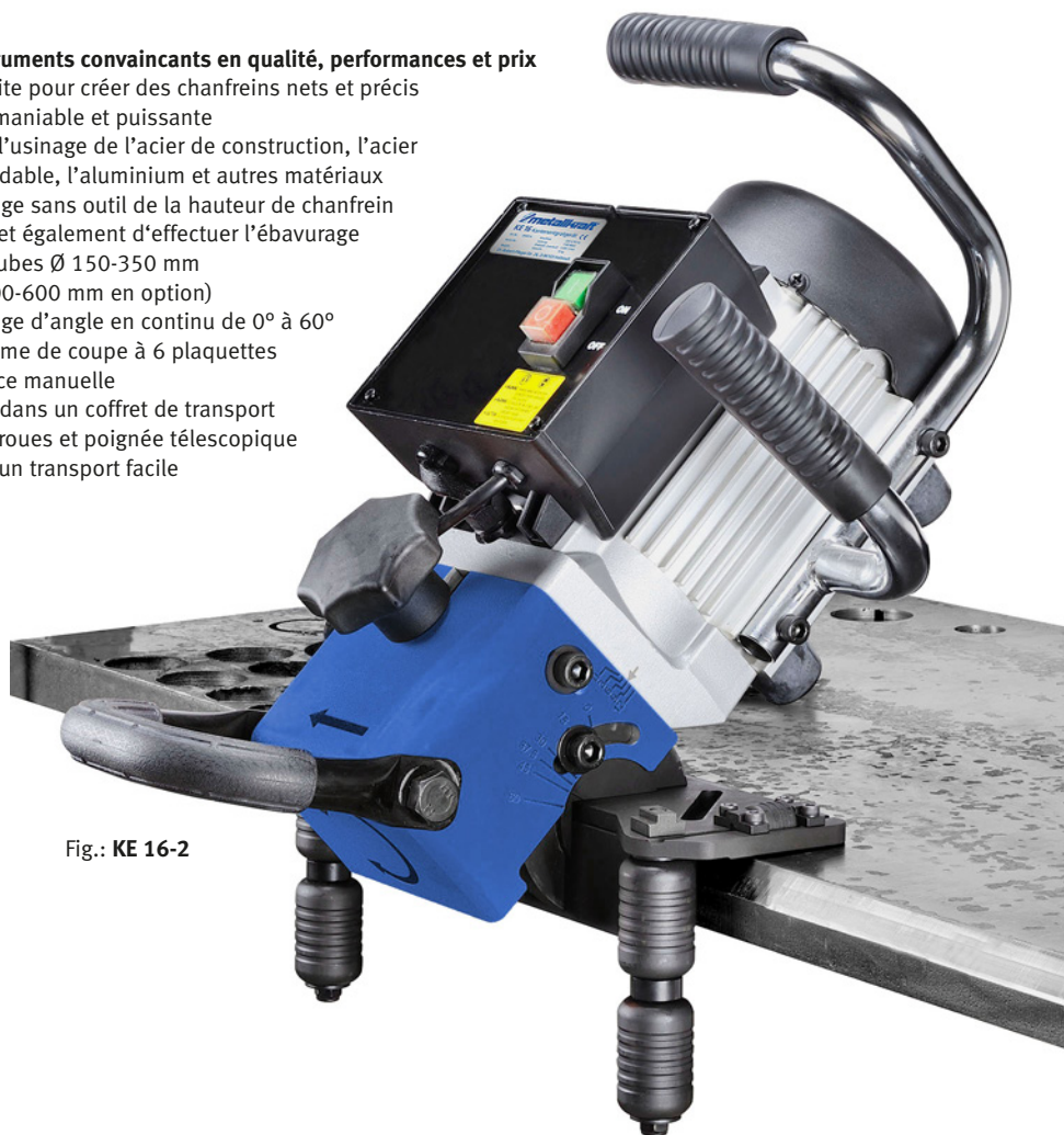
Fig.: KE 16-2